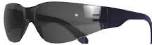
LENTES DE SEGURIDAD OSCURO