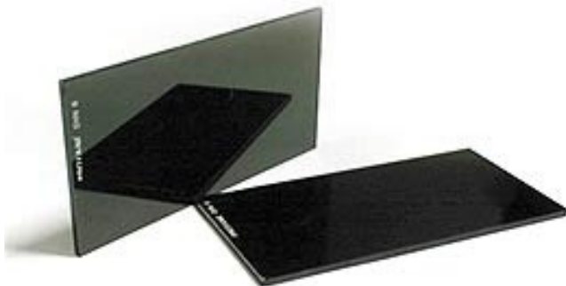
FILTRO PARA CARETA OSCURO