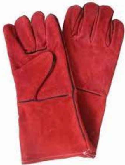
GUANTES PARA SOLDADOR