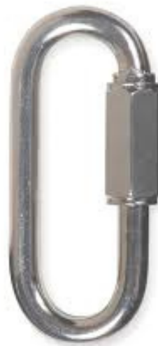
ESLABÓN DE ACERO