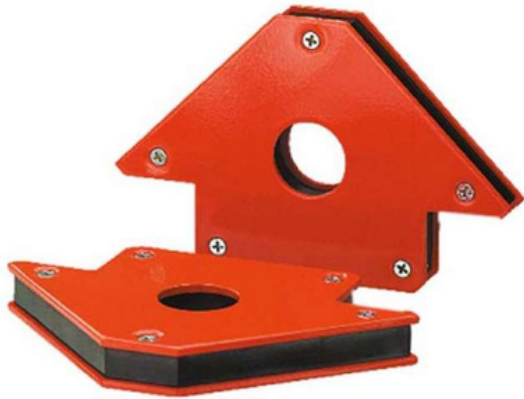
ESCUADRAS IMANTADAS PARA SOLDAR