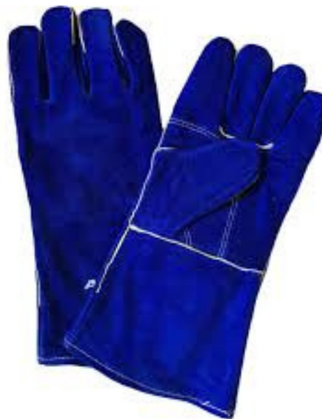
GUANTES PARA SOLDAR(ECONÓMICO)