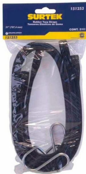
TENSORES ELÁSTICOS DE GOMA