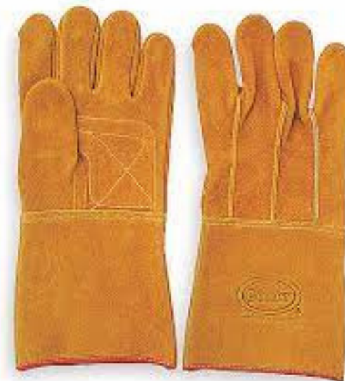
GUANTES DE CARNAZA LARGOS