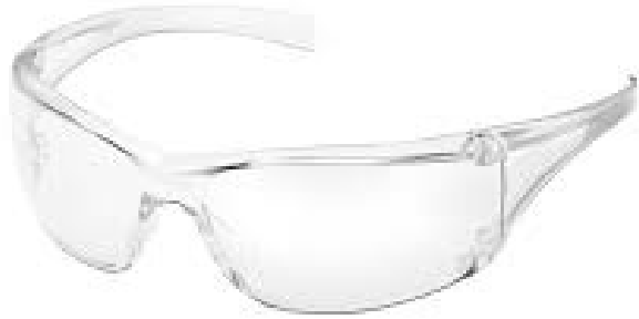
LENTES DE SEGURIDAD CLAROS